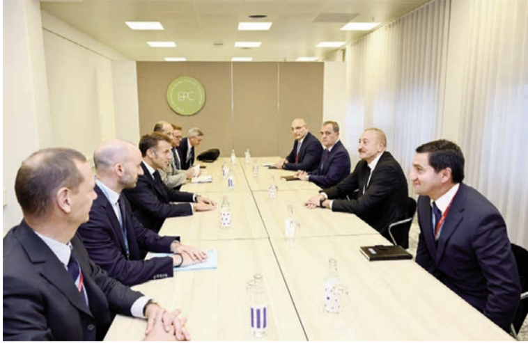
(Əvvəli 2-ci səhifədə)

Niderlandın Baş naziri Ermənistanla Azərbaycan arasında sülh gündəliyinin irəliyə aparılması ilə bağlı Vaşinqtonda əldə olunmuş nəticələrlə əlaqədar dövlətimizin başçısına təbriklərini çatdıraraq, bunun mühüm əhəmiyyət daşıdığını vurğulayıb.