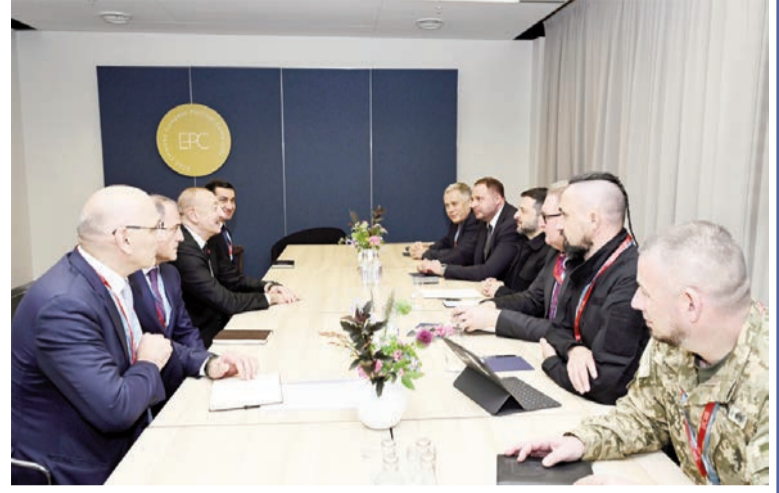
Təbriklərə görə təşəkkürünü bildiren Prezident İlham Əliyev Azərbaycanla Ermən-

Fransa Prezidenti Azərbaycanla Ermənistan arasında münasibətlərin normallaşması və sülh gündəliyi ilə əlaqədar nəticələr münasibətilə dövlətimizin başçısına təbrik edib.